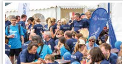
Treffpunkt Mannschaftszelt: Kaltgetränke, Muffins und Obst stärkten die Läufer