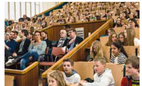
Hörsaal mit Schülern und Gästen

Über 360 Präventionsveranstaltungen hat es bislang gegeben, mehr als 80 000 Schüler aus Hamburg und der Umgebung haben daran teilgenommen: „Nichtrauchen ist cool“, immer donnerstags im Hörsaal der alten Frauenklinik, ist eine große Erfolgsgeschichte. Bei der Jubiläumsveranstaltung berichtete u. a. Schauspieler Sky du Mont von seinen Erfahrungen mit dem „blauen Dunst“. Infos: www.nichtrauchen-ist-cool.de .