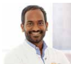
Arzt wollte Umes schon als kleiner Junge werden

„Heute würde der Traum in Erfüllung gehen. ... Heute endlich sollte es soweit sein. Ich würde sie wiedersehen. Ich sehnte mich nach ihr, nach der Frau, die mich auf die Welt gebracht hatte, die mich versorgt, gepflegt und vor dem Krieg gerettet hat. Sie hat viele Opfer gebracht und ihr Leben riskiert, um mir eine Zukunft zu schenken, in Deutschland, ohne Bomben, Soldaten, Waffen und Krieg.“ (Auszug)