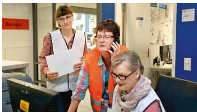
Eine Schlüsselfunktion: Casemanagement und IT arbeiten Hand in Hand, um die aufgenommenen Patientendaten ins IT-System einzuspielen