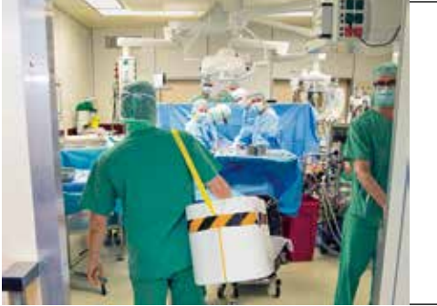
Organ im OP: Das UKE gehört bundesweit zu den größten Transplantationszentren