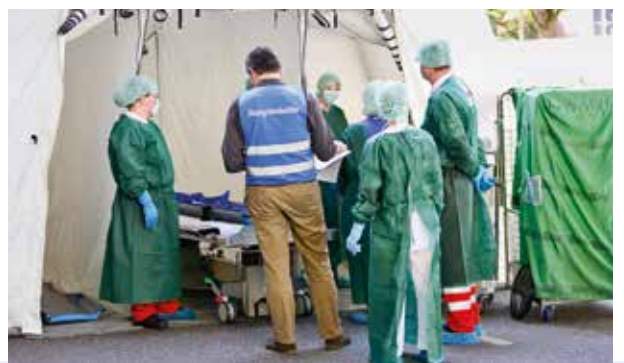
Nach dem Abduschen: Im sogenannten Weißen Bereich werden die von der Chemikalie befreiten Patienten für die Weiterbehandlung in der ZNA vorbereitet