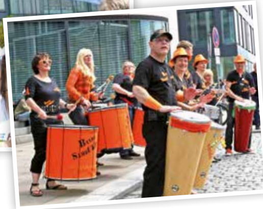
Besonderes Highlight: Die Samba-Truppe des UKE feuerte die Läufer auf dem letzten Abschnitt an