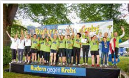
Acht Patientenboote ruderten um die Wette – und gewonnen haben sie alle