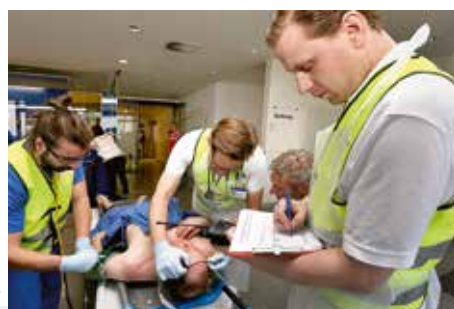
Für eine schnellstmögliche Sichtung und Behandlung bekommen alle Patienten eine Patientenkarte mit einer ID-Nummer umgehängt