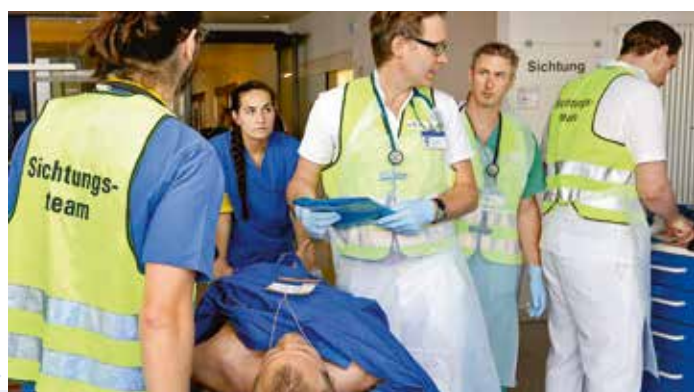
Wer muss wann behandelt werden? Jedem Patienten wird je nach Grad der Verletzung eine Dringlichkeitsstufe zugeordnet