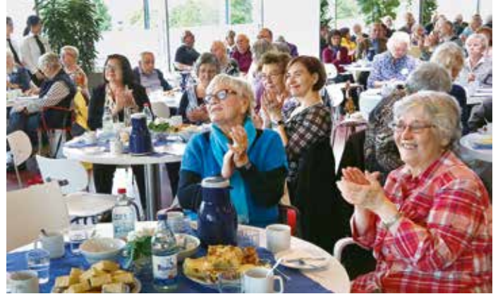
Rund 250 ehemalige Mitarbeiter nutzen die Gelegenheit, sich bei Kaffee und Kuchen wiederzusehen