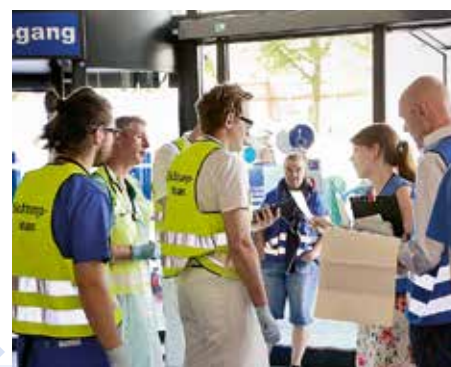
Sichtung: Hier übernehmen die Einsatzkräfte in der ZNA die von der Chemikalie befreiten Patienten und prüfen deren Verletzungen

Das Szenario: Ein Chemietanklaster rast in einen parkenden Reisebus, überschlägt sich, der Tank zerbricht. Buspassagiere kommen in Kontakt mit einer ätzenden Chemikalie. 50 Verletzte werden ins UKE gebracht. Sie müssen vor der eigentlichen medizinischen Versorgung in einem speziellen Dekontaminationszelt abgeduscht werden. Zum Glück nur eine Übung. UKE und Behörde sind mit dem Ablauf zufrieden.