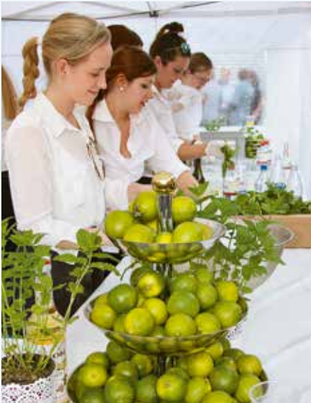
Heiß begehrtes Szenetränk Hugo: Allein in der ersten Stunde verbrauchten die Mädels am Ausschank 15 Kisten Limetten