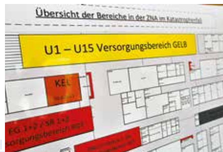
Im Katastrophenfall wird die Notaufnahme in Farbbereiche eingeteilt. Rot bedeutet zum Beispiel schwer verletzt