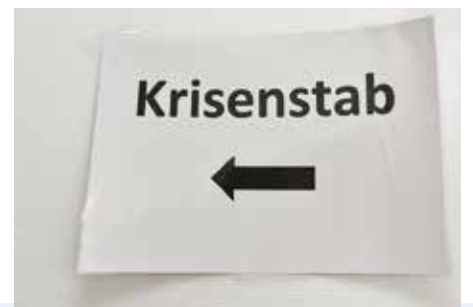
Hier entlang zum Krisenstab. Er koordiniert Personal, Nachschub und den Kontakt zu Behörden, Feuerwehr, Polizei und Presse