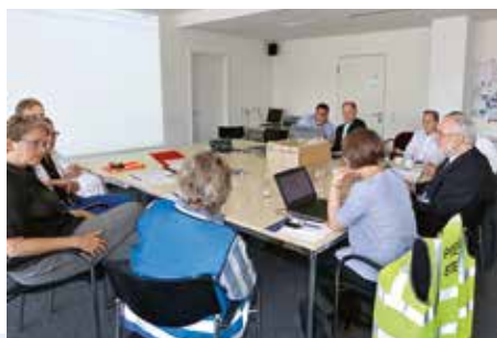
Der Krisenstab aus Vorstand, Medizin- und Strukturplanung, ärztlichen Leitern, IT, Sicherheit und Unternehmenskommunikation tagt