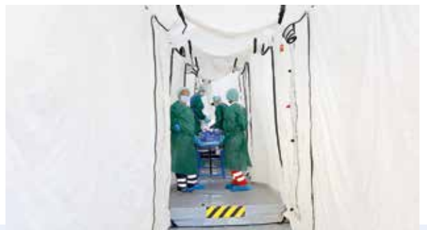
Im Zelt werden die mit einer Chemikalie in Berührung gekommenen Patienten dekontaminiert, gewaschen und mit Wasser abgebraust (oben und links)