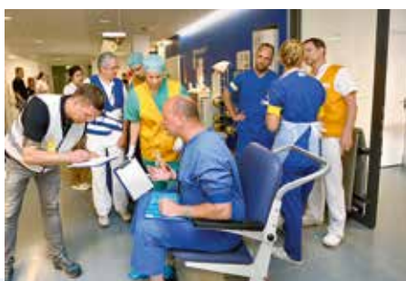
Patientenannahme im sogenannten Gelben Bereich: Der Verletzte, bei der Übung ein Schauspieler, gibt seine Patientendaten an