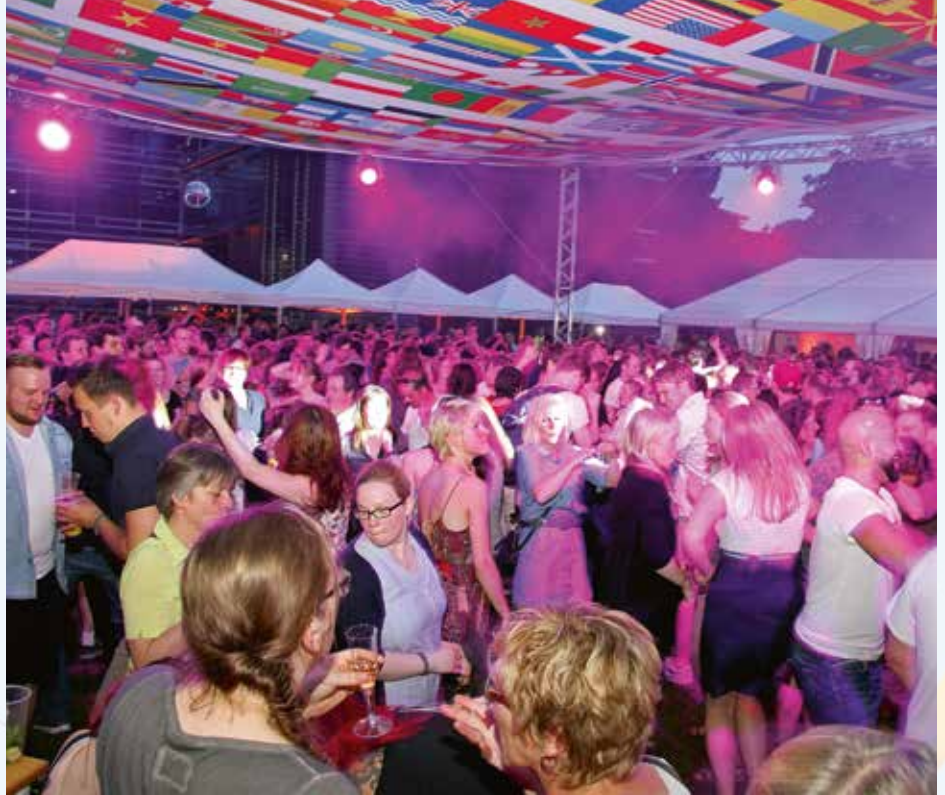
Aus riesigen Stoffbahnen mit internationalen Fahnen ließen die Organisatoren den Himmel für das Festzelt nähen