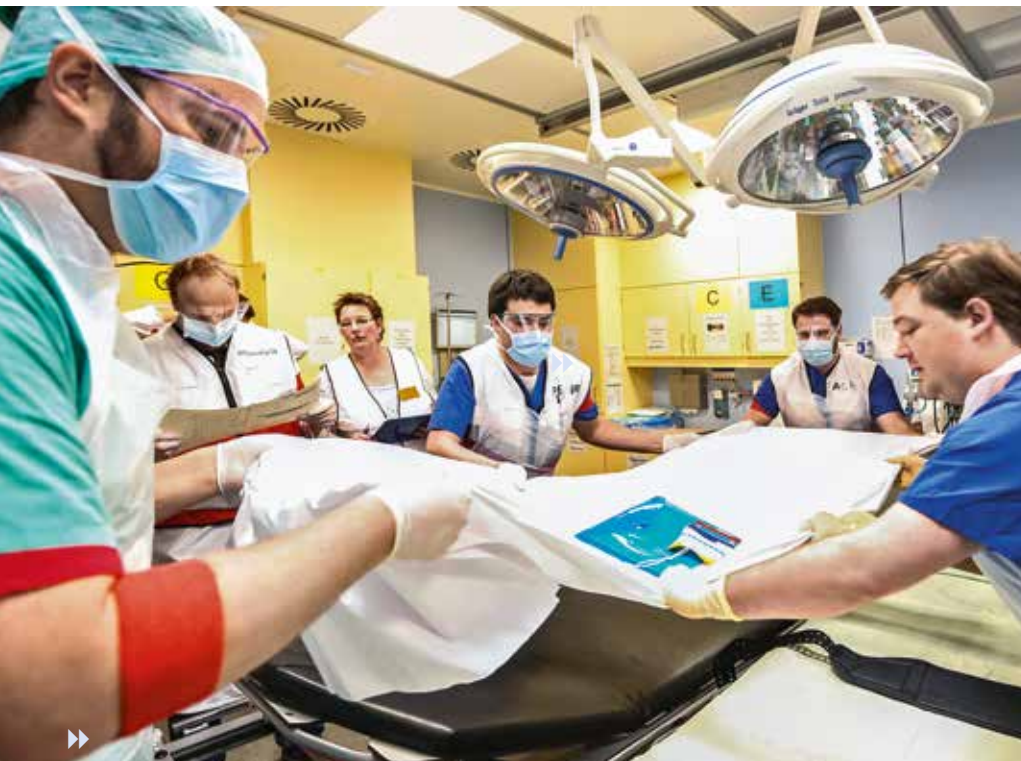
Selbst der fiktive „Papierpatient“ wird im Schockraum versorgt wie unter realen Bedingungen. Hier wird er auf die Trage umgelagert, um dort weiterbehandelt zu werden. Jeder Papierpatient hat, wie die „echten“ Simulationspatienten, eine eigene Krankengeschichte