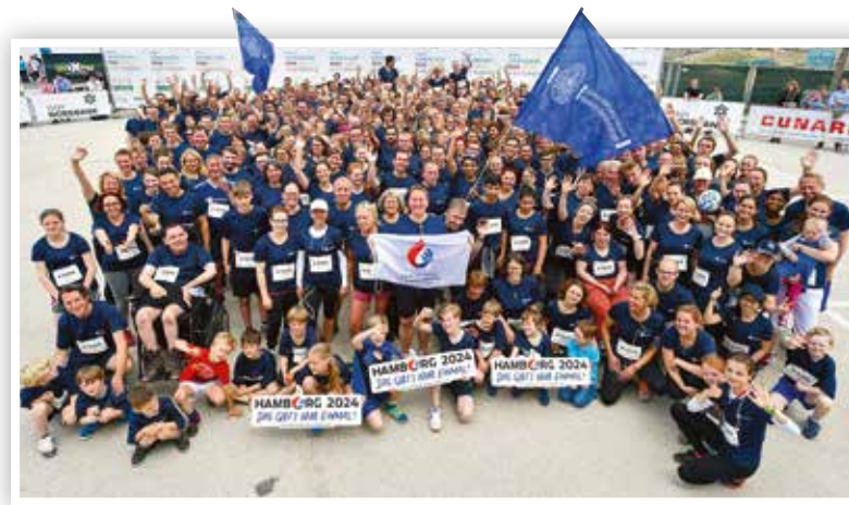
Von Anfang an gute Laune: Schon vor dem Start jubelten die UKE-Mitarbeiter beim offiziellen Fototermin