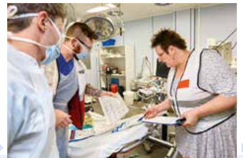
Dokumentation: Abgleich der Patientendaten zwischen den Mitarbeitern der ZNA und des Casemanagements im Schockraum