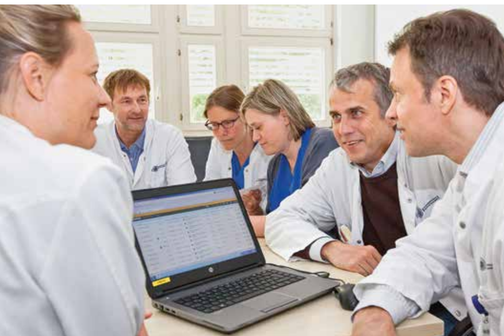
Einmal wöchentlich treffen sich – wie hier im UHZ – Mediziner, Pflegekräfte und Psychologen zur organspezifischen interdisziplinären Transplantationskonferenz