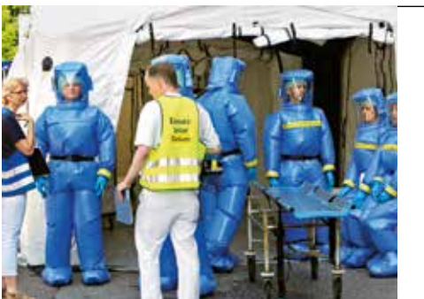
Sicher ist sicher: Notfallübung von UKE und Behörden erfolgreich verlaufen