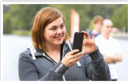
Senatorin Katharina Fegebank postet „Rudern gegen Krebs“ auf Facebook

Auch wenn die Hamburg Allstars das Benefizspiel „Kicken mit Herz“ erneut für sich entscheiden konnten, gab es nur einen echten Gewinner: die Kinder-Herz-Station des UKE, für die am Kinder-Herz-Tag 250 000 Euro zusam-