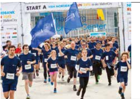
Tolles Team: 460 UKELer gingen gemeinsam beim HSH Run an den Start