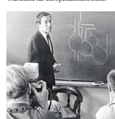
Christian Barnard pflanzte Washkansky das neue Herz ein

Soll 1963 wurden in Deutschland 124.269 Organe transplantiert (günstliche Lebens- und Dominanzspenden, letztere sind Transplantationen von mindestens zwei Organen zwischen mehreren Personen). Übertragen wurden 12.118 Herzen, 2343 Lungen und 80.294 Nieren. Außerdem wurden 22.850 Lebern und 2964 Bauchspeicheldrüsen